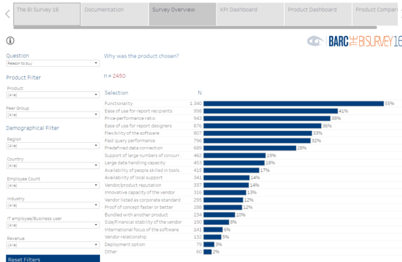
Illustration 2 : BI Survey Analyzer

Avec sa fonctionnalité originale « BI Survey Analyzer », BARC met à la disposition des visiteurs de « bi-survey.com » un outil en ligne interactif leur permettant de réaliser des analyses individuelles qui s'appuient sur les retours utilisateurs de l'étude « The BI Survey 16 ». La version de base gratuite permet, entre autres, de filtrer les données par région, secteur, groupe comparatif et taille d'entreprise. La version premium offre de plus la possibilité d'effectuer une présélection personnalisée de produits et de la comparer sur la base de 32 critères différents.